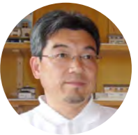
(有) コウ設計工房 大沢宏

木の家に住む自然志向の建て主さんは、庭の一部を小さな畑にしてい る方も結構いらっしゃいます。 畑でなくとも、プランターなどで栽培できる野菜もたくさんあります ので、野菜づくりをしたことない方は、是非挑戦してみてください。 なすやピーマンはビギナー向き、ミニトマトやきゅうりも比較的簡単 ですよ…。 木の家に暮らし、庭で取れた野菜を薪ストーブで料理…なんて素敵 ですよ。 僕は、薪ストーブでは焼き芋くらいしかやりませんが、サツマイモは 非常に出来が悪かったのでこの冬は焼き芋も食べていません。