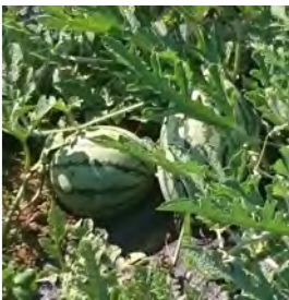
マターポールスイカ