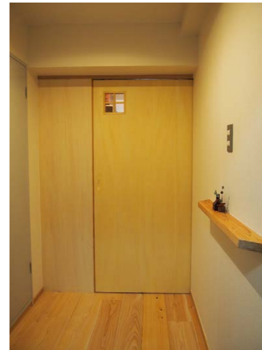
玄関前にもうけた引戸

玄関から室内まで筒抜けだったので、玄関に引戸を設けて室内へワンクッション置けるようにしました。事務室部分は作業スペースと打合せスペースを背の低い家具で仕切り、狭い部屋をなるべく広く感じるようにしました。